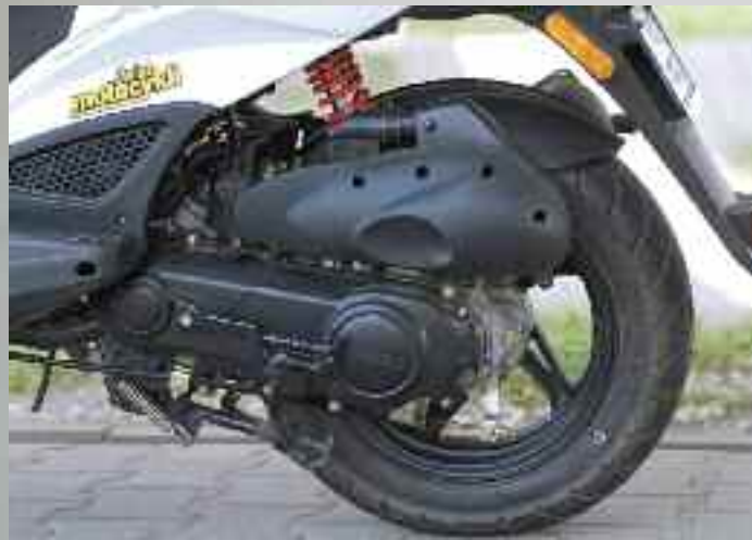
Do napędu użyto znany z innych modeli Kymco (poza ZX-em) chłodzony powietrzem dwusuw o mocy 5 KM