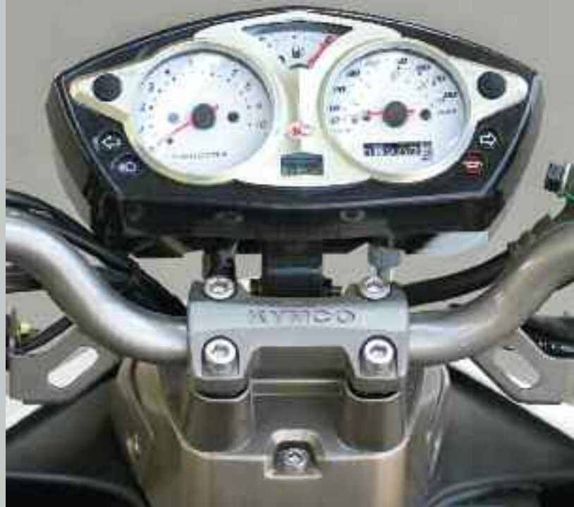
Wskaźniki, umieszczone w osobnej obudowie, wyglądają jak w motocyklu