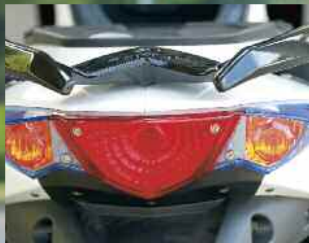
Tylna, zespolona lampa zapewnia dobrą widoczność skutera przy każdej pogodzie

nej podstawie stoczy się po pochylonym podłożu.