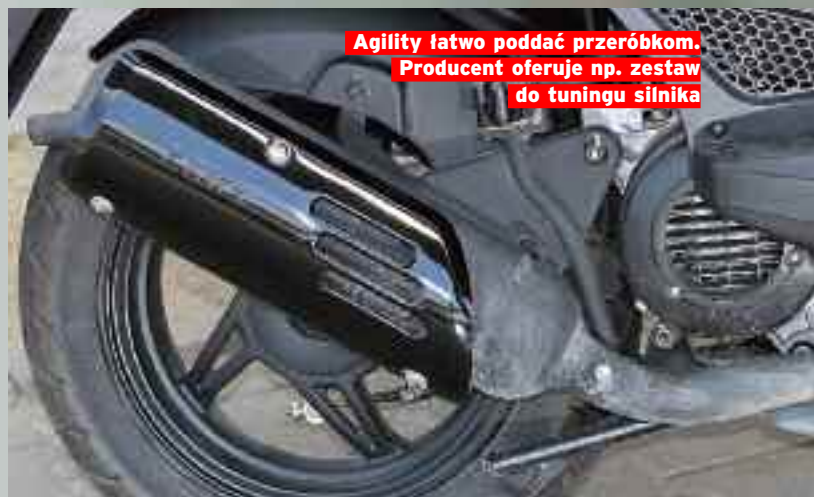
Agility łatwo poddać przeróbkom. Producent oferuje np. zestaw do tuningu silnika