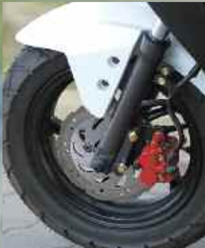
Dużą, przednią tarczę wzięto z mocniejszej wersji Agility